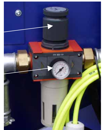
Bild 6.5 Einstellrad für Druckluft