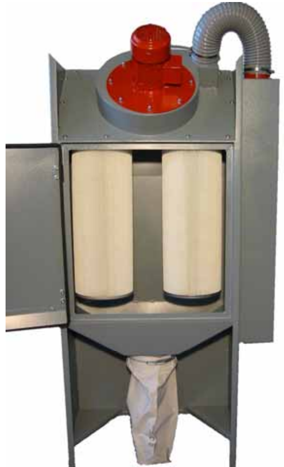
Bild 9.1 Filtergehäuse