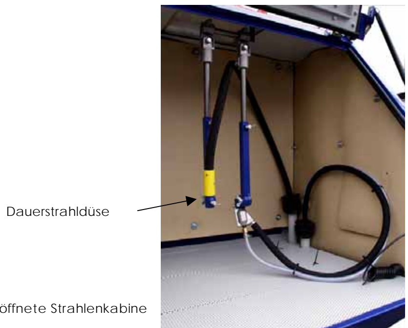
Bild 6.2 geöffnete Strahlenkabine