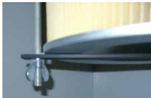
Bild 9.2 Flügelmutter unter der Filterplatte