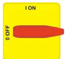
Bild 6.4 Hauptschalter der Strahlkabine

Nur spannungsisoliertes Werkzeug benutzen!