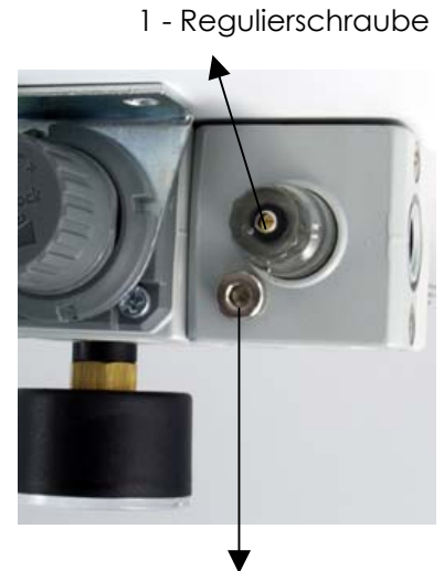
Bild 7.2 Draufsicht der Wartungseinheit

Je nach Handstück variiert die benötigte Ölmenge. Bitte informieren Sie sich in der entsprechenden Bedienungsanleitung der Handstücke.