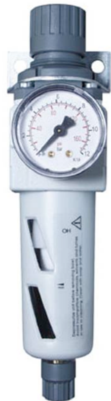
Bild 7.1 Wartungseinheit JOKE® Dryjet (Best.-Nr. 0 004 060)

Die optimale Funktion der Druckluft-Feilmaschine wird durch Einsatz der Wartungseinheit JOKE® Dryjet gewährleistet.